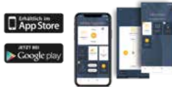
Smart-Home-App TaHoma® App