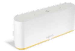
Smart-Home-Zentrale TaHoma® Switch

Wenn Sie sich für ein voll ausgerüstetes Smart Home entscheiden, vernetzt die Smart-Home-Zentrale TaHoma® Switch von Somfy Ihre bereits installierten Funk-Anwendungen. Damit können Sie Ihren Innen- und Außensonnenschutz sowie Ihre Terrassenprodukte per Smartphone oder Tablet automatisch steuern und programmieren.